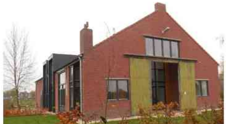
Foto links: Zaakvoerder Toon Lenssen (staande 3 e van links) met zijn medewerkers en foto rechts: de intern verbouwde tuinbouwloods tot woning.