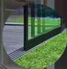
SCHUIFWANDEN & OVERKAPPINGEN