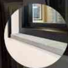
KOZIJNEN & HORREN

STIJLVOLLE KUNSTSTOF EN ALUMINIUM KOZIJNEN, VAKKUNDIG GEÏNSTALLEERD