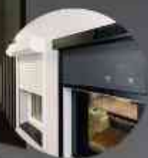
ROLLUIKEN & BUITENZONWERING