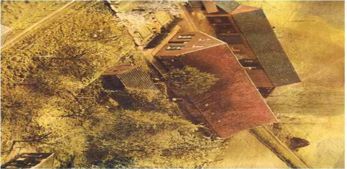
Boerderij "De Nies" omstreeks 1951