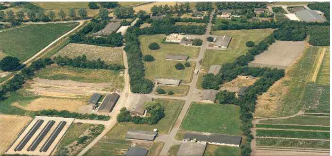
Luchtfoto 1979 leerbedrijf "De Nies"

In 1972 werd door de Praktijkschool (Pluimveevakschool) in de omgeving van de boerderij het leerbedrijf "De Nies" gebouwd.