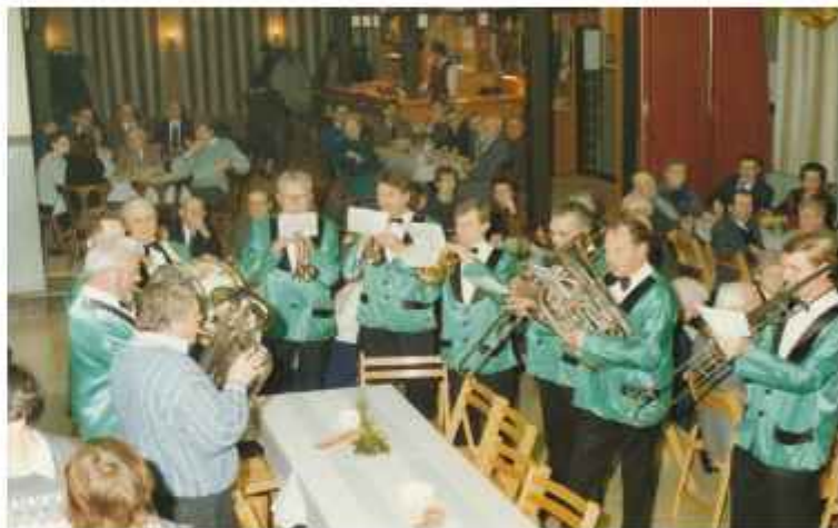
Joekskapel "Laeve Zat" tijdens een serenade op 12 januari 1989 bij gelegenheid van het 20-jarig bestaan van het ouderenkoor "Herleving"