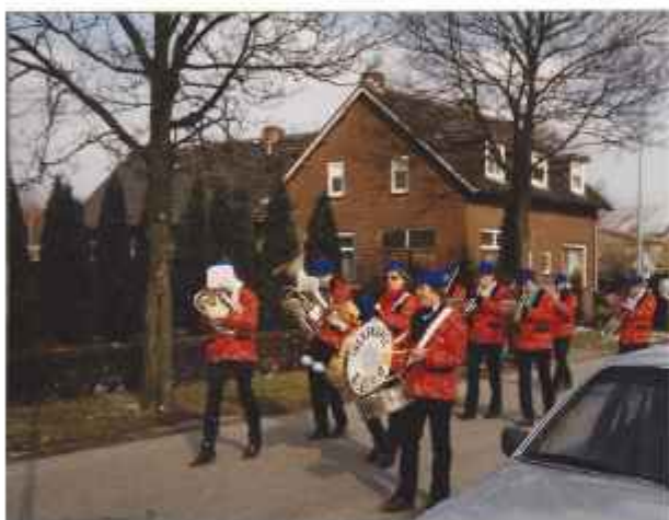
Joekskapel "Alles Um" tijdens opluistering carnavalsoptocht

In de loop der jaren zijn veel joekskapellen gestopt, zo ook de beide joekskapellen uit ons dorp.