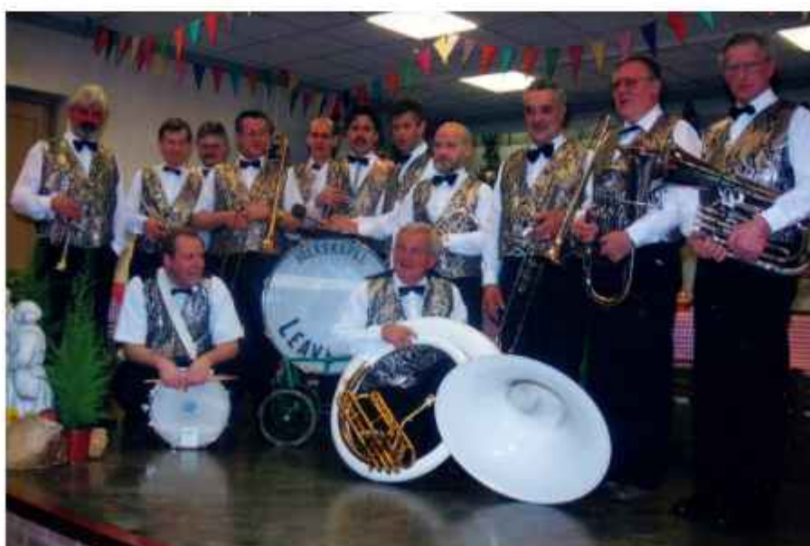
1995 Joekskapel "Laeve Zat"